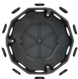
10 entradas com tampas