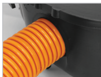
Encaixes totalmente selados