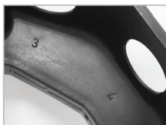
Entradas para conduítes numeradas